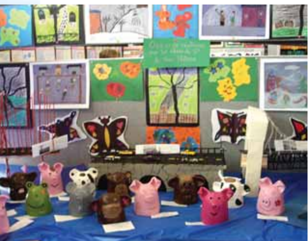
Les arts occupent une place de choix à Charles-Rodrigue.