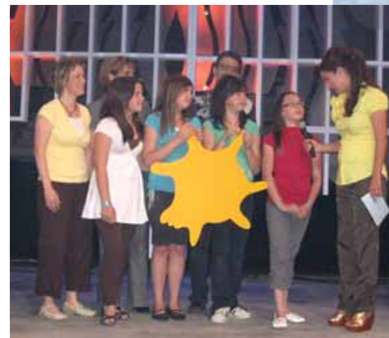
C'est avec fierté, que des jeunes filles se sont rendues, à leur initiative, au téléthon d'Opération Enfant Soleil.