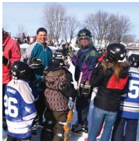
À la fête des neiges, un match personnel VS élèves. Devinez qui a gagné? ...L'histoire ne le dit pas!