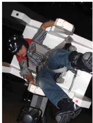
Toute l'école a vécu une journée au Cosmodôme. Quel voyage... dans l'espace!