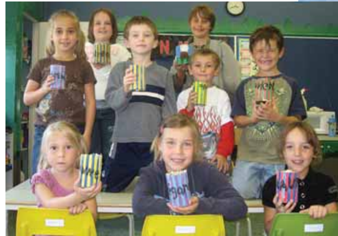
Au service de garde de Dosquet, la créativité est à son comble. Les enfants ont créé, à leur image, leur contenant pour amasser les bâtons privilèges qui leur permettront de mériter des récompenses comme apporter à la maison la mascotte du service de garde « Moustache le hamster ». Au service de garde, joie, plaisir et bonne humeur sont au rendez-vous.