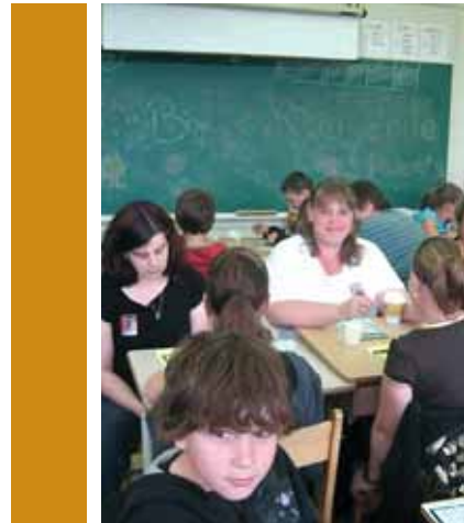
Lors de la Semaine de la famille, nous avons organisé un bingo où parents et grands-parents étaient invités à venir s'amuser à l'école. Les élèves avaient préparé des cartes de bingo sur lesquelles étaient écrits des mots en lien avec la famille. Puis, les familles ont participé à différents jeux de mots. Voilà une merveilleuse occasion d'ouvrir nos portes sur notre milieu.