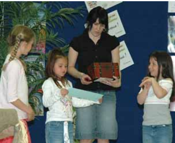
En collaboration avec l'École des Parents, nous avons invité, élèves et parents, à une grande fête de la lecture. L'activité des « Aventuriers du livre » avait pour objectif de nous faire voir les livres d'une autre façon et ainsi développer notre goût et notre amour de la lecture. Ce fut une belle occasion de se laisser transporter dans le monde merveilleux des livres.