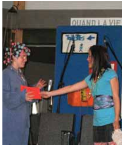
Dans le cadre d'un projet en entrepreneuriat, les élèves du 3 e cycle de l'école ont présenté la comédie « La Déprime » qui a pu être réalisée grâce à l'implication de tous les élèves. Une équipe était chargée des décors pendant que les comédiens répétaient. Le tout était supervisé (orchestré) par l'équipe de production qui veillait à la gestion et à la promotion du projet.