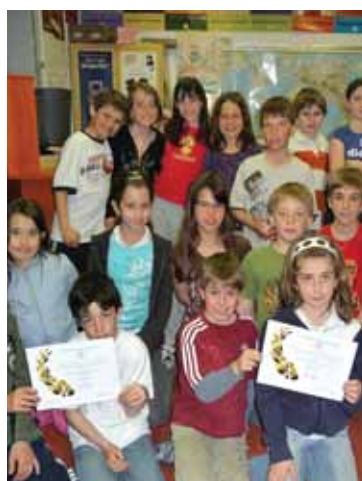
Zoo-Mousserons, coup de cœur 2007-2008 au Concours québécois en entrepreneuriat.