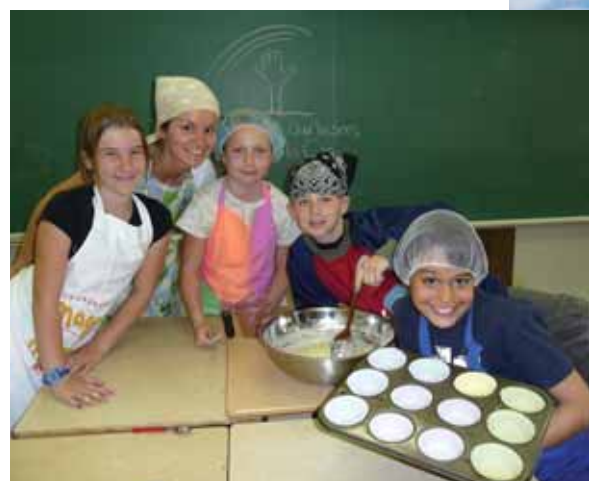
Cuisine collective pour le club des petits déjeuners.