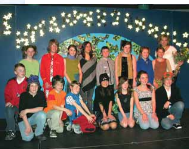
« Sois hyperpersonnalisé » Projet en collaboration avec le CAFEC.