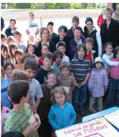
Le 10 e anniversaire du service de garde « Les Mousserons ».