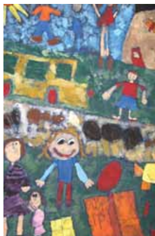
Pour la 30 e et dernière année, le pavillon la Fourmière accueillait en 2007-2008 des élèves du préscolaire. Pour souligner cet événement, une murale a été confectionnée par les élèves et a été dévoilée en présence de leurs parents et d'invités spéciaux.