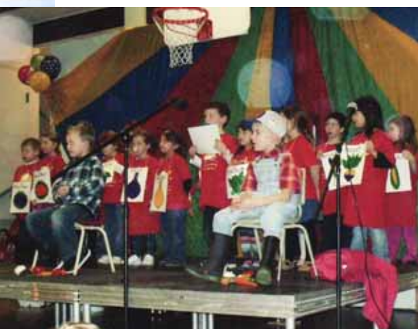
10 e anniversaire du Service de garde : « Le Petit Navire ».