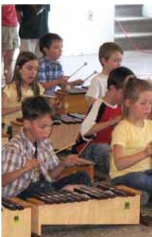
Projet pédagogique particulier du 1 er cycle : « Spectacle ».