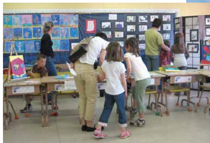
Projet pédagogique particulier du 2 e cycle : « Musée des petits artistes ».