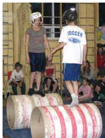
Projet pédagogique particulier du 3 e cycle : « Spectacle ».