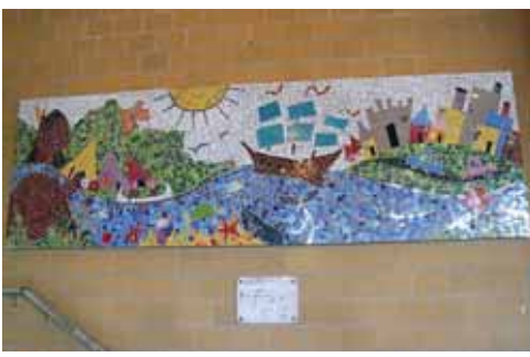
Dans le cadre du 400 e de Québec, plusieurs activités ont été vécues dont la création d'une magnifique mosaïque en morceaux de céramique qui reflète bien l'implication de tous les élèves et de l'artiste M. Mathieu Bergeron. Cette œuvre intitulée « D'hier à aujourd'hui » s'est inspirée de l'œuvre de M. Frédéric Back « Le fleuve aux grandes-eaux ».