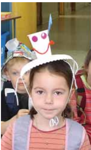
Dans le cadre de la journée de la terre, les chapeaux faits de matières recyclées étaient à l'honneur.