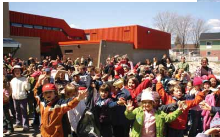
Un lundi tout en musique à travers la province de Québec. Les élèves de Saint-Joseph étaient honorés de démontrer leur savoir-faire et leur implication.