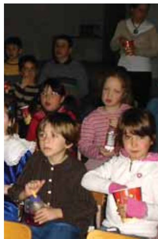
L'École Saint-Joseph a instauré une activité récompense chaque mois pour susciter le respect du silence dans les déplacements.