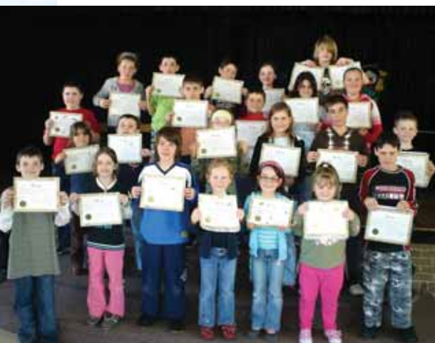
Les méritas soulignent le respect des règles et viennent ajouter à l'estime des élèves. Ceux-ci sont toujours fiers d'être honorés devant toute l'école.