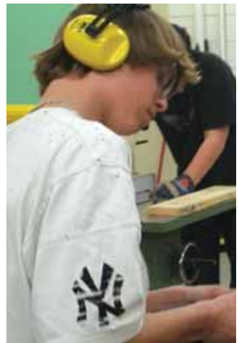
La sécurité et la créativité doivent être au rendez-vous pour la fabrication de prises d'escalade avec l'entreprise MATO.