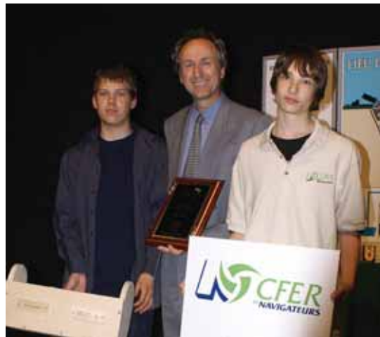
Le CFER des Navigateurs remporte un mérite provincial aux Olympiades Réussite Jeunesse du Réseau québécois des CFER devant 14 CFER participants.