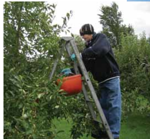
Un étudiant en stage, à l'automne 2007, au Verger de Tilly situé à Saint-Nicolas.