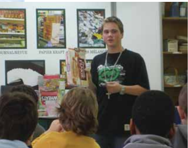
Un étudiant présente la Caravane de la récupération. En 2007-2008, le CFER a effectué 34 présentations qui ont rejoint 1229 jeunes et adultes.