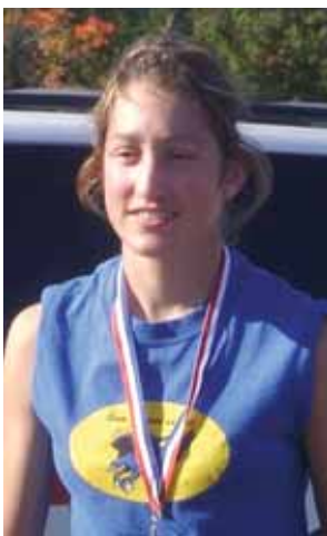
Chaque année, plusieurs élèves participent au cross-country organisé par la commission scolaire.