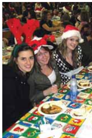
Le réveillon annuel est devenu une belle tradition à Pamphile-Le May !