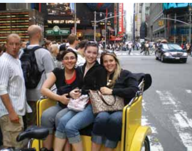
En juin, nos élèves finissants se sont rendus à New York. Quel beau moment pour terminer son secondaire !