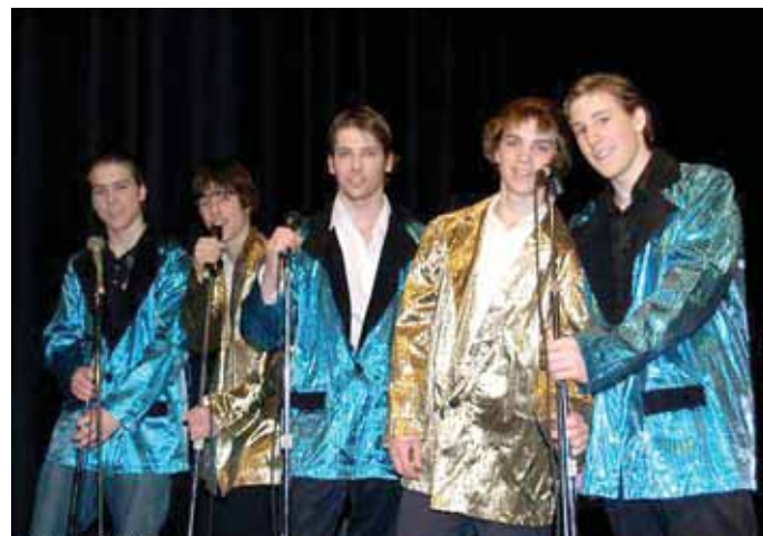
La comédie musicale des élèves de 4 e secondaire fut un succès mémorable! La tradition est partie, on en refait une cette année encore !