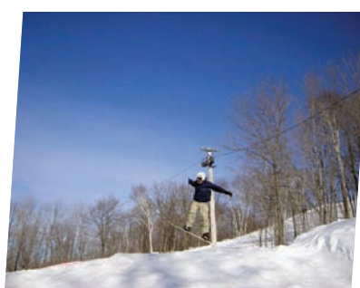
Un esprit sain dans un corps sain, c'est un principe de santé de base en éducation.