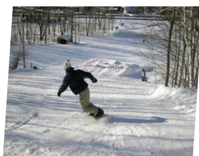
Les activités sportives favorisent le développement des habiletés sociales.