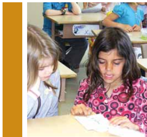
L'école présente des projets de promotion de la lecture entre classes.