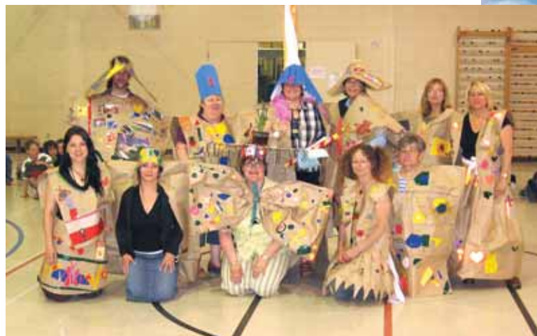
L'école compte sur un service de garde dynamique et engagé.