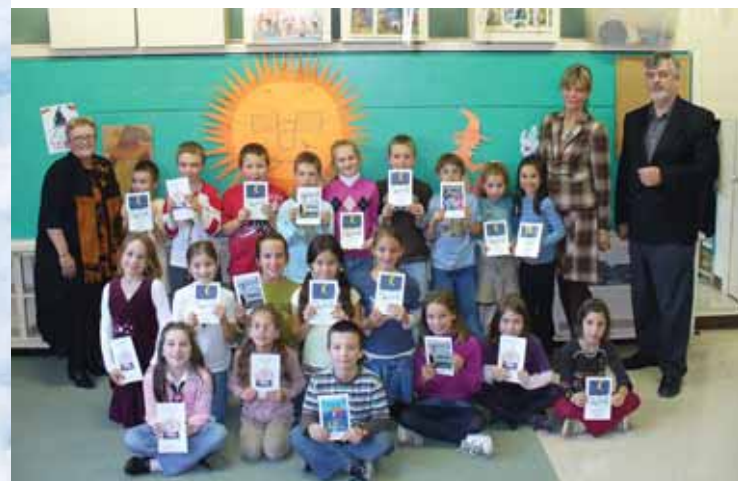
Une ouverture sur le monde par la réalisation d'un projet de livre avec des élèves du Mexique.