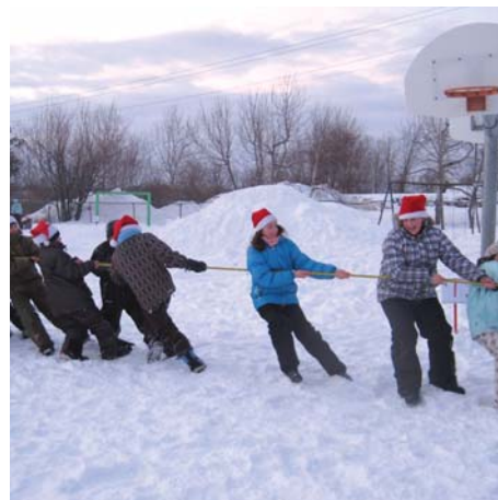
Fête de Noël 2008.