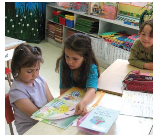
Cercle de lecture.