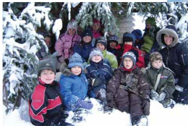
Cérémonie de la lumière à Noël