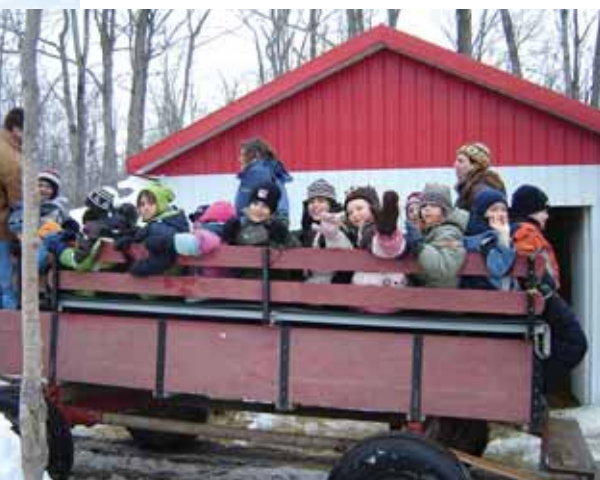
Sortie à la cabane à sucre