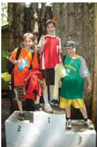
Aventures au camp Inukshuk