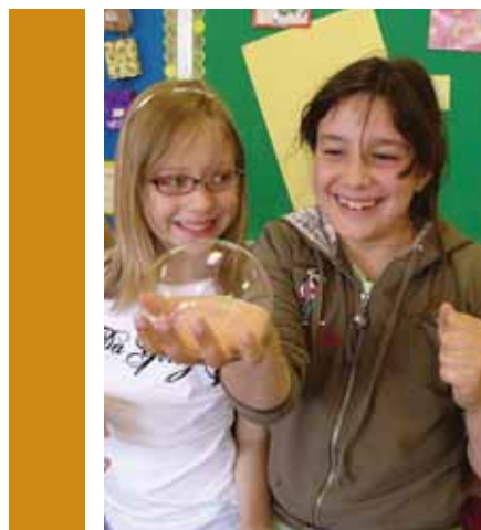
Expérimentation en science et technologie sous le thème des bulles