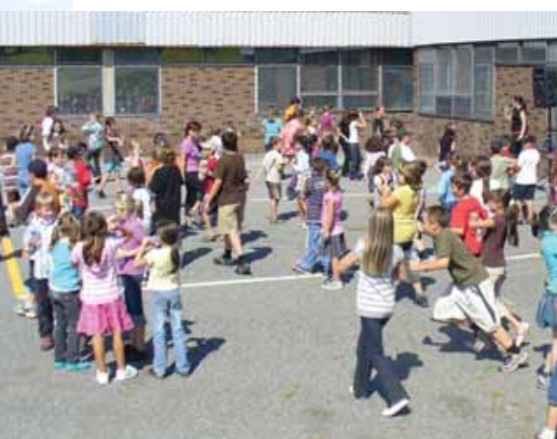
Vivre des activités de groupe pour la santé et la motivation.