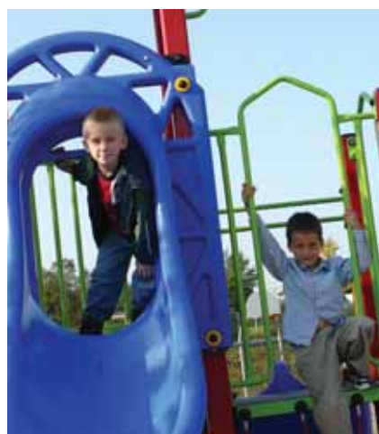
De nouvelles structures, de nouveaux plaisirs.