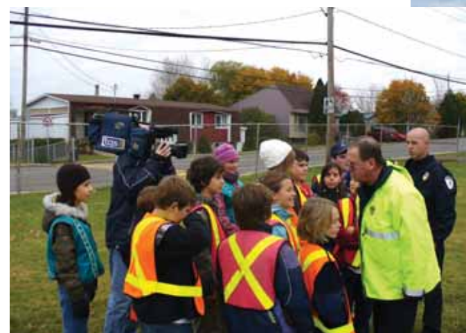
Présentation des nouvelles voitures de police de Lévis.