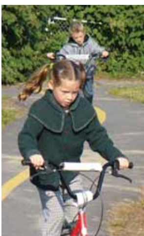
Le développement de certaines habiletés physiques.