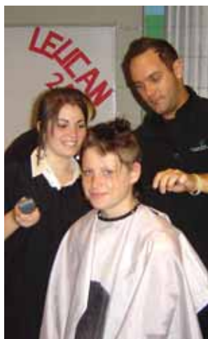
Défi têtes rasées de LEUCAN.