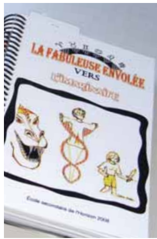
Recueil de textes.