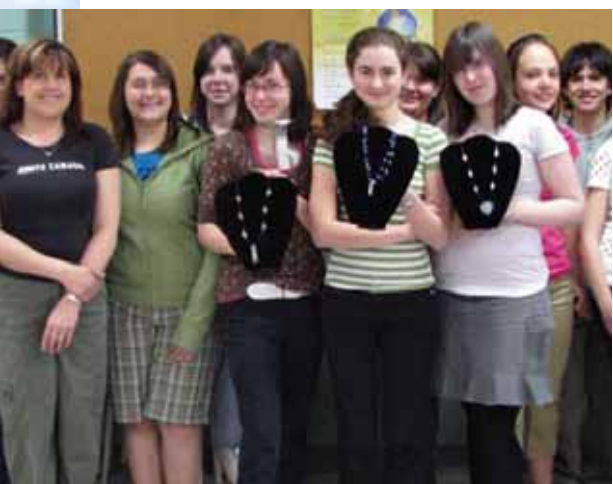
Prix « coup de cœur » de la minientreprise scientifique.