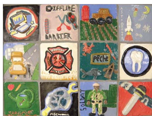
C'est une production en céramique sur les métiers, faite en équipe par mon groupe, dans le cadre du cours d'arts plastiques!