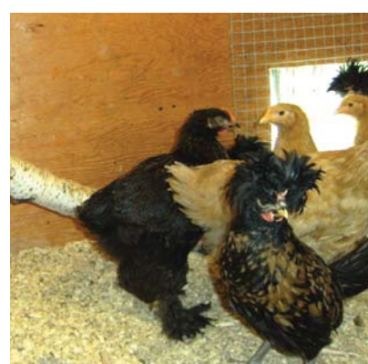
Je tente des expériences entrepreneuriales - « Nous, on élève des poules ».