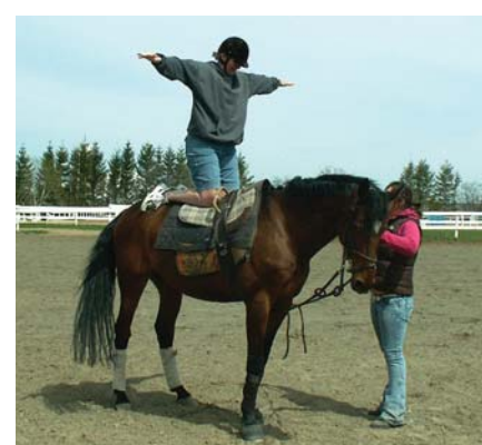
Après avoir participé aux travaux du Centre équestre, je peux enfin monter à cheval!