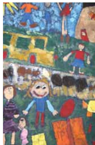
Pour la 30 e et dernière année, le pavillon la Fourmière accueillait en 2007-2008 des élèves du préscolaire. Pour souligner cet événement, une murale a été confectionnée par les élèves et a été dévoilée en présence de leurs parents et d'invités spéciaux.