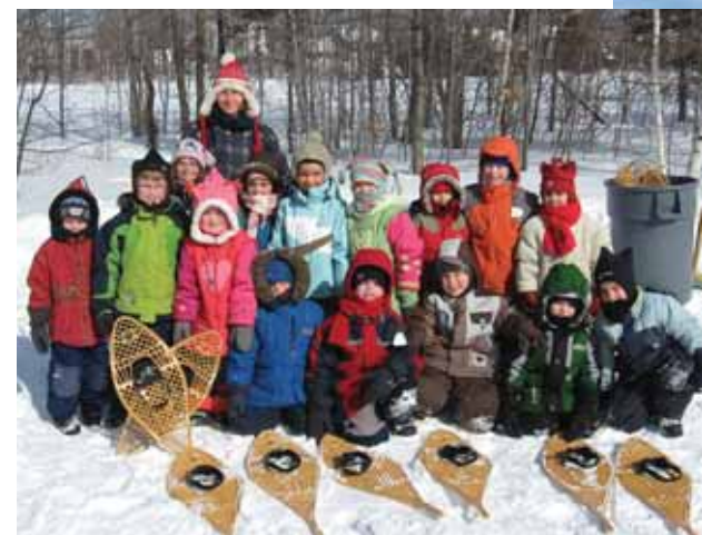
Prendre l'air, faire du sport, impliquer les parents, la Fête de la Neige nous a permis de vivre tout cela en une même journée. Une autre façon de développer de saines habitudes de vie et de développer le lien école-famille !