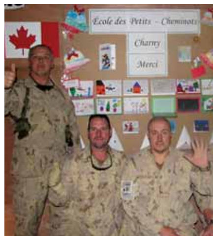
À l'occasion de Noël, nous avons fait parvenir des cartes de vœux aux soldats canadiens alors en mission en Afghanistan. Ceux-ci nous ont répondu et nous ont signifié combien ce petit geste a été très apprécié. Ce fut un des projets du comité EVB de l'école.