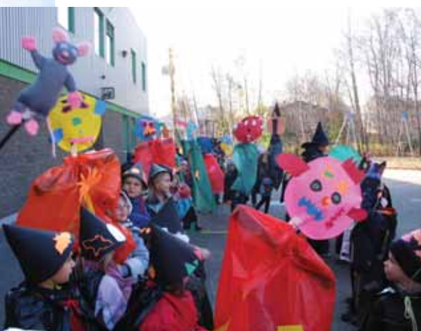
La fête d'Halloween fut un événement grandiose. Toute l'école s'était transformée en « École des Sorciers » et la fête s'est terminée par une grande parade dans le quartier.