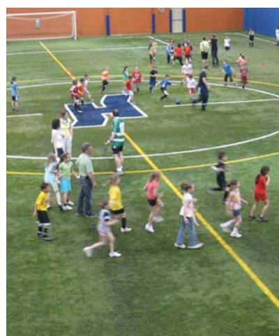
Le traditionnel « Mondial de soccer » a eu lieu au Stade Honco. C'est là que se sont affrontés les pays représentés par les différentes classes de l'école.