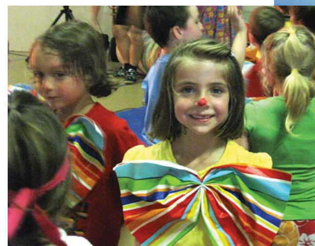
L'année scolaire a débuté et s'est terminée sous le thème du cirque. En fin d'année, ce sont tous les élèves de l'école qui ont été mis à contribution dans le cadre d'un spectacle auquel toute la population a été invitée.