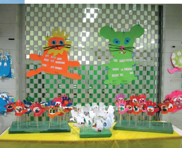
À l'occasion de la fête de la terre, c'est par les arts et la poésie que les élèves ont été appelés à exprimer leur attachement à cette belle planète.