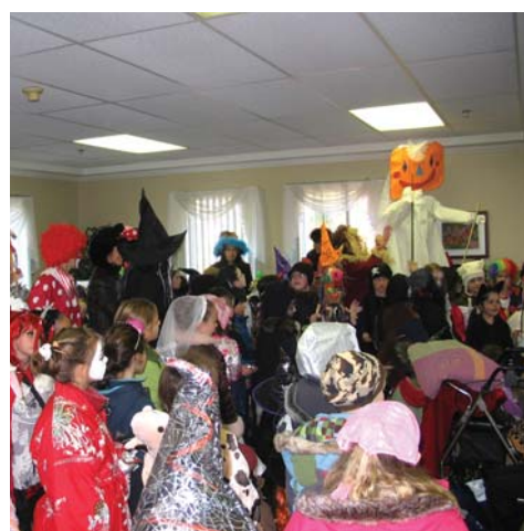
À l'occasion de l'Halloween, les élèves du pavillon Notre-Dame sont allés partager leur joie et leur fierté avec les personnes âgées qui habitent dans deux résidences de Charny.