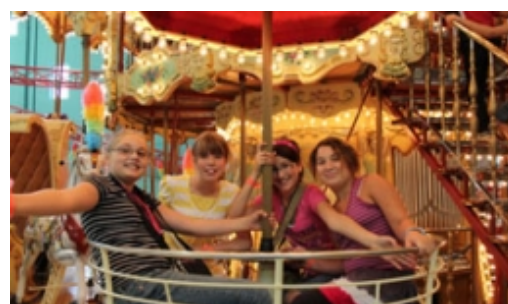
Une grande sortie au Mégaparc des Galeries de La Capitale pour tous les élèves de l'école