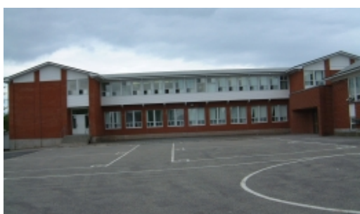
École du Bac

À compter de la rentrée scolaire 2012, les élèves pourront bénéficier d'une nouvelle bibliothèque qui sera à la fois scolaire et municipale. De plus, l'ajout de cinq locaux de classe et de deux locaux du service de garde supplémentaires permettra d'offrir un milieu de vie de qualité à tous les jeunes Lambertains.