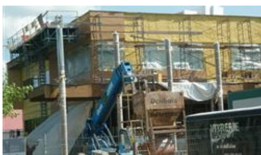
Une école en transformation