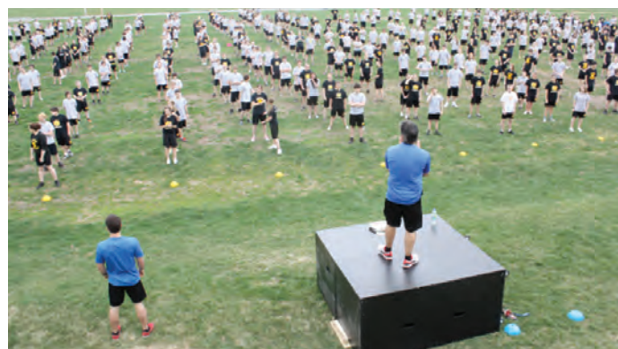
Activité « Beaurivage s'active » le 9 mai 2013