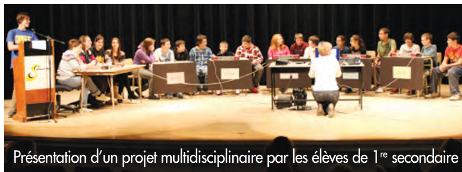
Présentation d'un projet multidisciplinaire par les élèves de 1 re secondaire