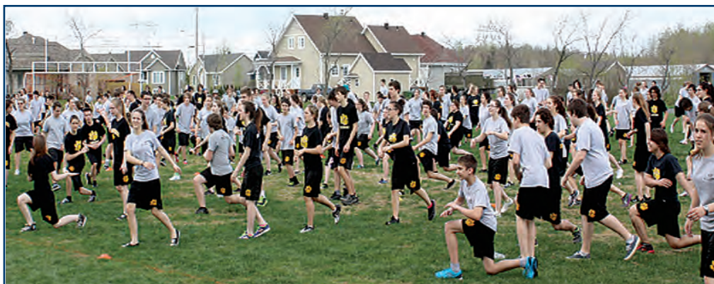
Troisième présentation de l'activité « Beurivage s'active », mai 2014