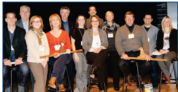
Organisation de l'activité des Dragons de Lotbinière