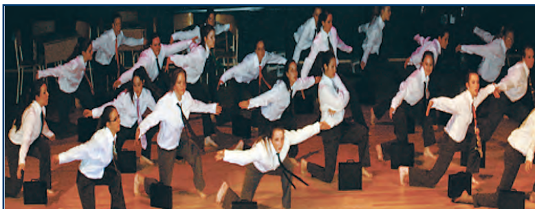
Prestation des élèves de danse, mai 2014