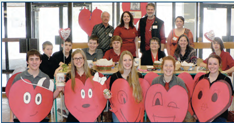
Collecte pour un ancien élève de Beurivage ayant une maladie grave