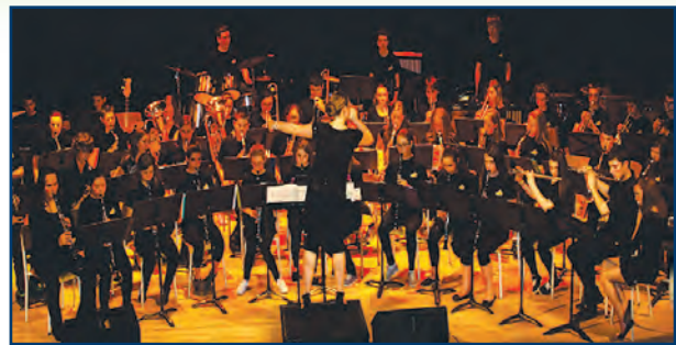
Présentation du concert, mai 2014