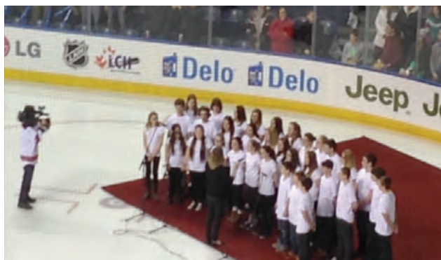
Les élèves du profil Musique au match des Remparts

Située au cœur de la municipalité de Saint-Agapit, notre institution d'enseignement offre une formation de qualité aux élèves de 1 re à 5 e secondaire. La population du secteur de Beaurivage est fière de son école. Les élèves proviennent des municipalités de Saint-Agapit, Saint-Apollinaire, Saint-Gilles, Sainte-Agathe, Dosquet et de Saint-Étienne. Elle accueille 585 élèves.