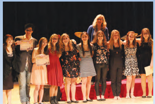
Les participants à la soirée Poésie