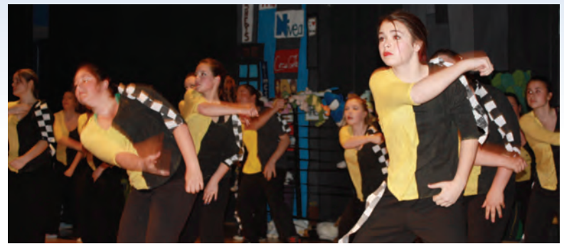
Spectacle de danse en mai