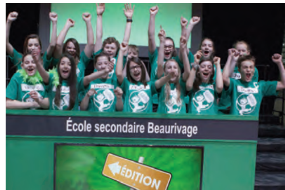
L'Équipe de 1 re secondaire à l'émission « Dernier Passager »