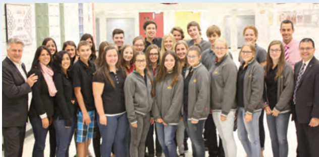
Les élèves de LCI5 rencontrent les députés Lessard et Gourde