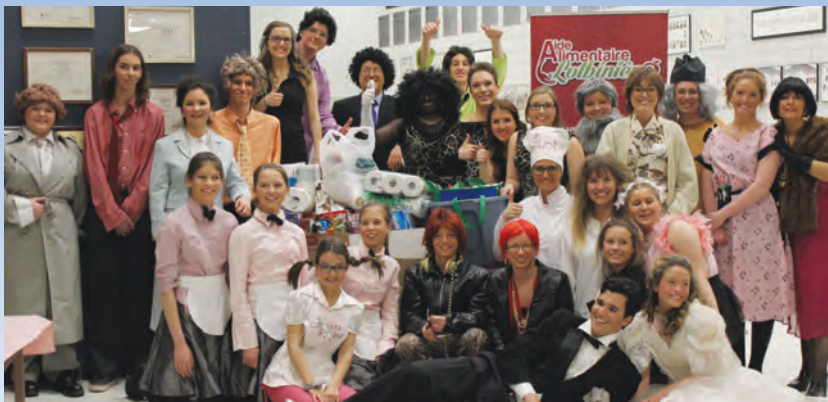
Les « Noces de cœur » au profit de l'Aide alimentaire de Lotbinière