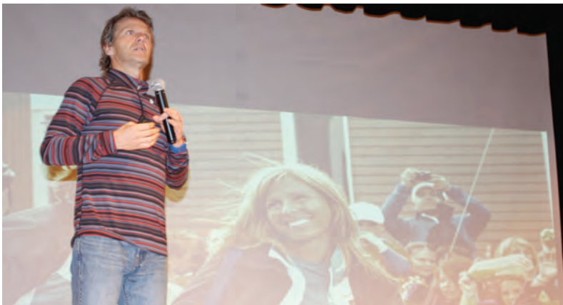
Conférence de Pierre Lavoie (Grand défi Pierre Lavoie)