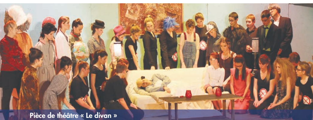
Pièce de théâtre « Le divan »