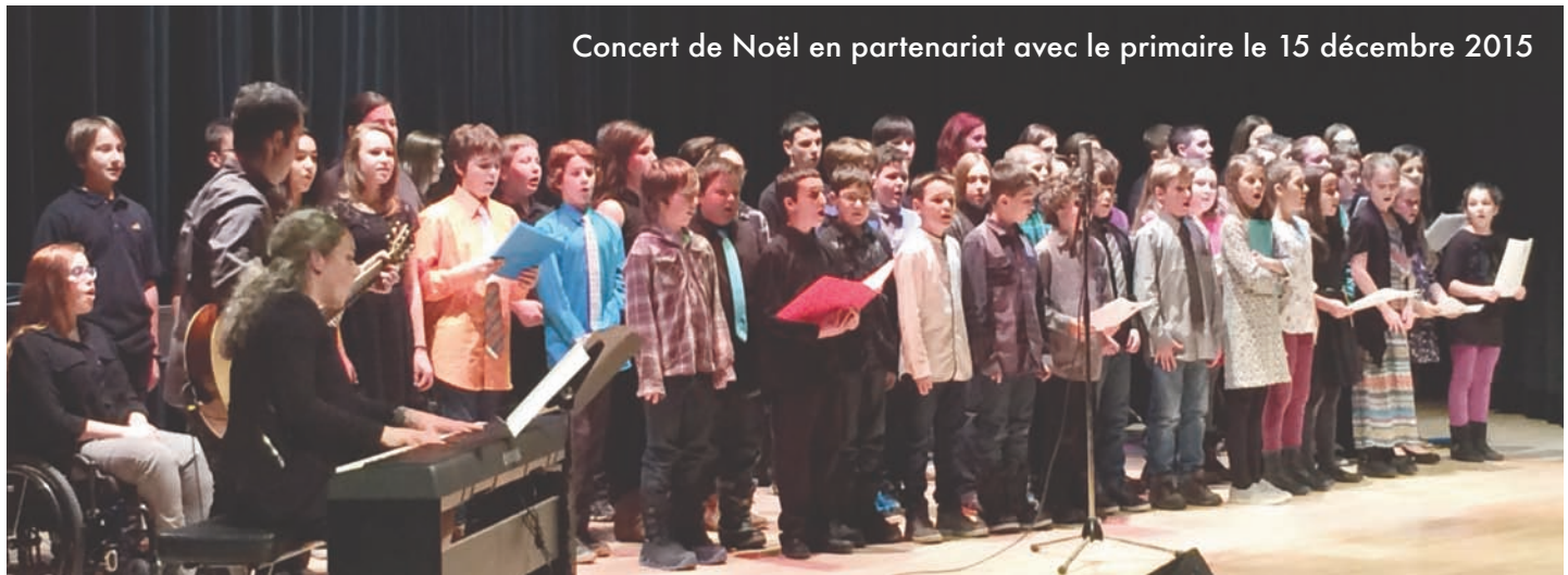
Concert de Noël en partenariat avec le primaire le 15 décembre 2015

Située au cœur de la municipalité de Saint-Agapit, notre institution d'enseignement offre une formation de qualité aux élèves de 1 re à 5 e secondaire. La population du réseau de Beurivage est fière de son école. Les élèves proviennent des municipalités de Saint-Agapit, Saint-Apollinaire, Saint-Gilles, Sainte-Agathe, Dosquet et de Saint-Étienne. Elle accueille 602 élèves.