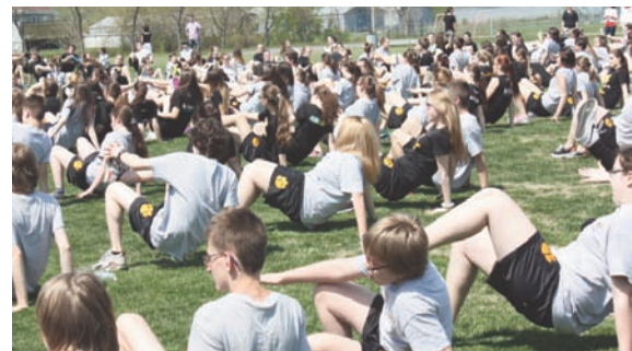
Activité « CrossFit » le 24 mai 2016