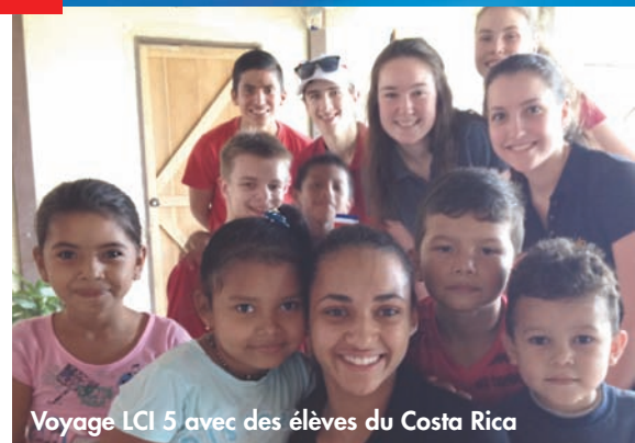
Voyage LCI 5 avec des élèves du Costa Rica