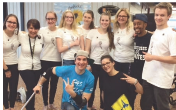
Les organisateurs de la venue de Lazy Legs

À l'École secondaire Beauvillage, les activités sont nombreuses :