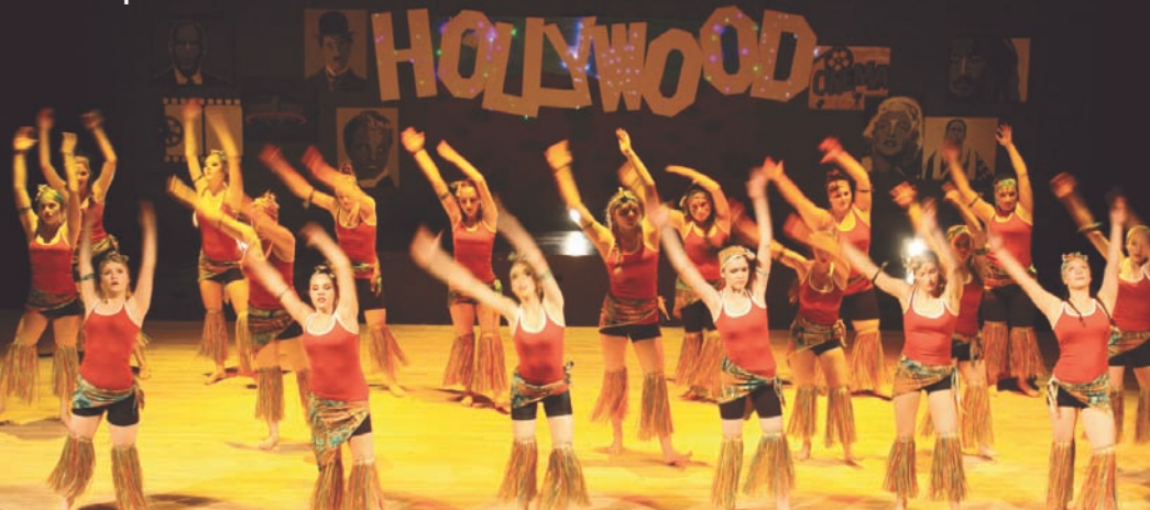
Spectacle de danse le 12 mai 2016