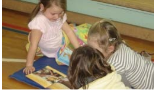
Les élèves de l'École Belleau, Gagnon participent à différents projets de lecture, pour leur plus grand plaisir !