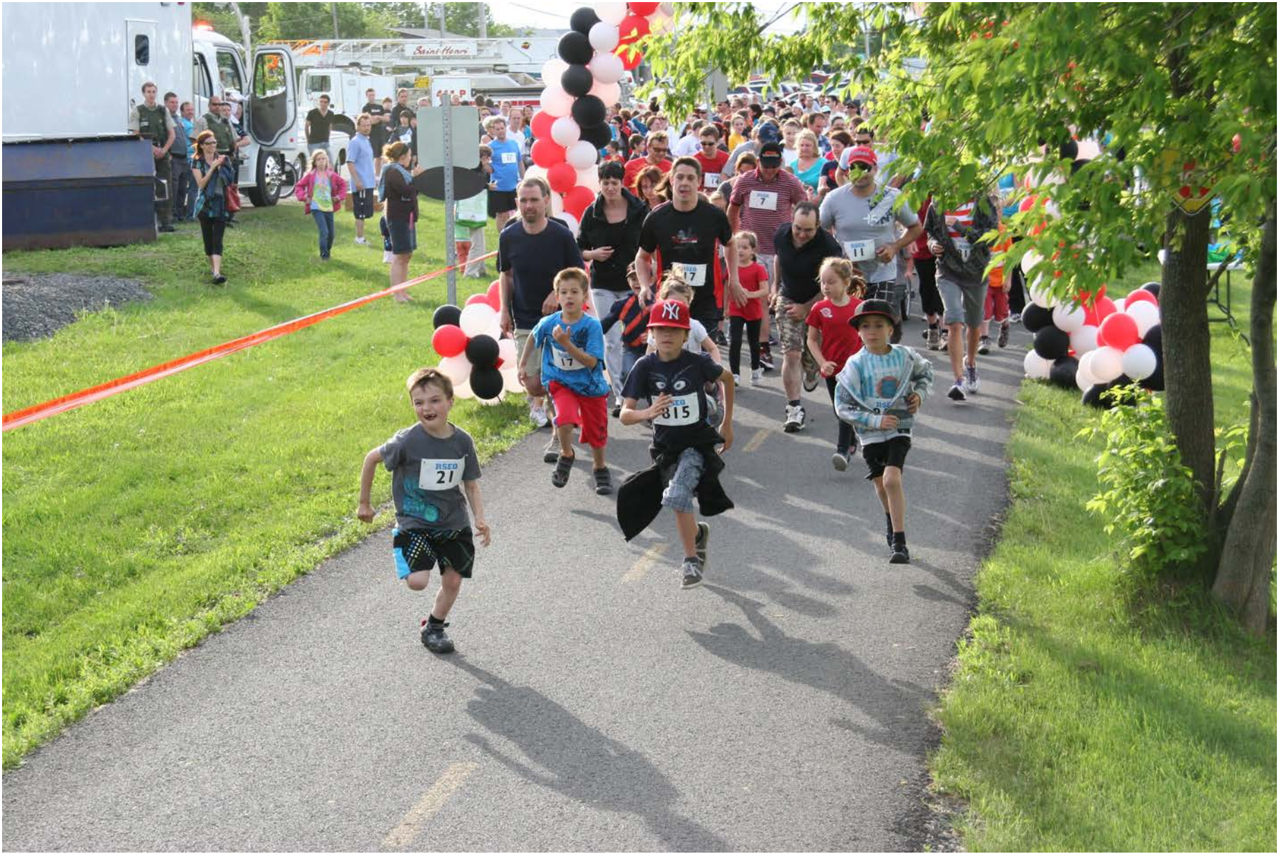
La première édition de la course Petits pas en coeur a permis aux élèves et à leurs parents de se surpasser !