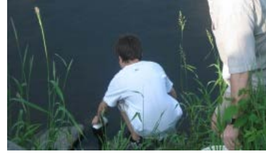
Les élèves prennent part à divers projets environnementaux, comme la mise à l'eau de petits saumons dans la rivière Etchemin.