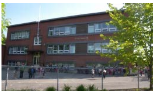
L'École Gagnon, un milieu de vie pour les élèves du préscolaire et du 1 er cycle du primaire.

L'enjeu pédagogique principal pour le personnel de l'établissement est l'apprentissage du français, particulièrement en lecture, et de façon plus précise, la compréhension en lecture, la fluidité, l'augmentation du vocabulaire et l'utilisation d'un vocabulaire varié. Plusieurs actions ont déjà été mises de l'avant à cet effet. De plus, afin de donner une couleur particulière à notre école, le personnel a intégré les Arts du cirque et de la scène lors de divers projets. Pour la prochaine année scolaire, cette thématique sera élargie afin de permettre aux élèves de découvrir d'autres perspectives, et ainsi de s'ouvrir au monde qui les entoure.