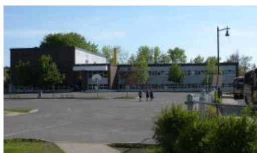
L'École Belleau, une école stimulante pour les élèves du 2 e et 3 e cycle du primaire.