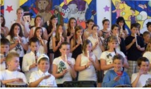
Le talent des élèves de l'École Belleau, Gagnon était à l'honneur lors des deux spectacles de juin. Les élèves ont su impressionner l'auditoire !