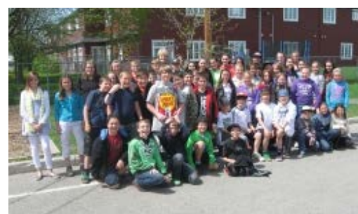
Nos fiers finissants de l'École Belleau, Gagnon ! Nous leur souhaitons beaucoup de succès à l'école secondaire !