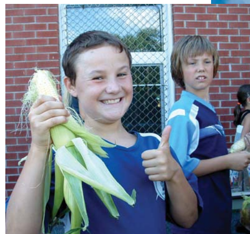
Grande épluchette de blé d'Inde et kermesse lors de la rentrée scolaire en lien avec le développement du sentiment d'appartenance et afin de créer de nouveaux liens élèves-élèves, élèves-enseignants.