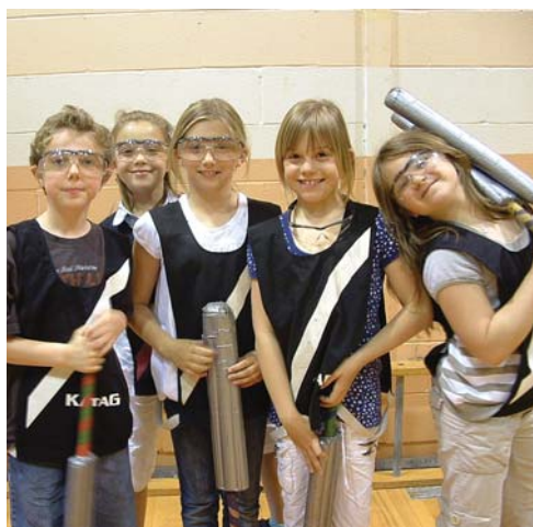
Activité de fin d'année « KATAG » : deux équipes s'affrontent à l'aide d'épées en mousse. L'objectif est de mettre hors jeu les joueurs de l'autre équipe en les touchant avec son épée mousse. La première équipe à avoir mis hors jeu tous les joueurs adverses marque un point. À ce système de base sont ajoutés plusieurs personnages et scénarios qui permettent de varier les parties.