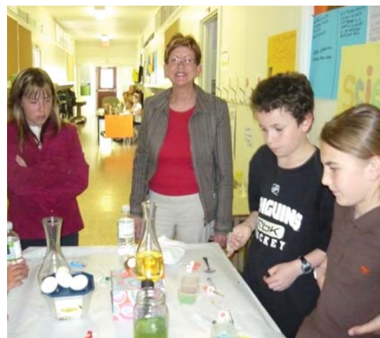
« Des jardins de compétences » : projet de décloisonnement par cycle où les élèves sont regroupés selon leurs champs d'intérêts. Présentation de l'atelier des sciences aux parents lors de l'exposition des ateliers en soirée.