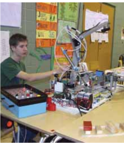
Les sciences à l'avant-scène L'ESLE est un milieu scientifiquement animé ! L'école a accueilli la dernière édition de l'Expo-sciences de la région de la Chaudière-Appalaches et de Québec. Ce fut un moment privilégié pour les élèves d'une trentaine d'établissements scolaires de démontrer leur savoir-faire et de s'ouvrir au monde des sciences et de l'environnement.