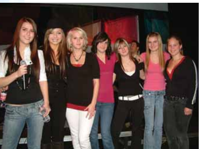
La Virée d'enfer La Virée d'enfer est un grand événement permettant à des élèves d'exploiter leurs ressources artistiques en démontrant lors de cinq galas leurs talents vocaux et musicaux. Sous la supervision de professionnels du spectacle, les jeunes développent leur potentiel et expriment leur savoir-faire devant leurs pairs. Tout en poursuivant leurs études, ils sont amenés à cheminer dans leur démarche artistique. Dépassement de soi, persévérance et encadrement de qualité leur permettent de devenir des modèles de détermination pour tous les élèves de l'école et une source de fierté pour leurs parents.