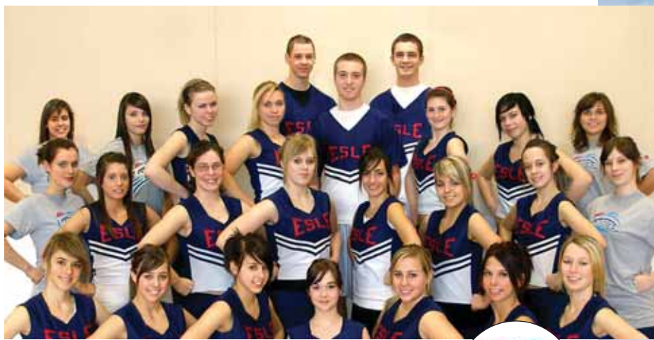
Le Torrent D'une compétition à l'autre, les équipes sportives du Torrent n'ont pas froid aux yeux ! Que ce soit au football, soccer, basket-ball, volley-ball ou badminton, les jeunes athlètes maintiennent un harmonieux équilibre entre la réussite scolaire et l'activité sportive. Visant rien de moins que l'excellence, Le Torrent se veut également l'expression du sentiment d'appartenance à l'ESLE. La population étudiante est d'autant plus nombreuse à venir les encourager !