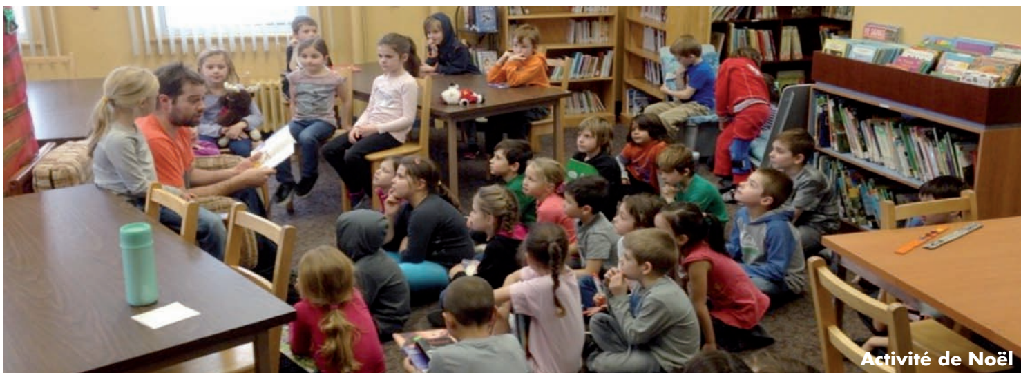
Activité de Noël