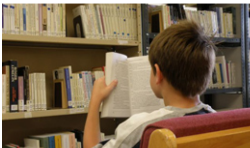
La lecture au cœur de la réussite.

Un bon pourcentage de jeunes qui atteignent un objectif qu'ils se sont fixé pendant leur séjour.