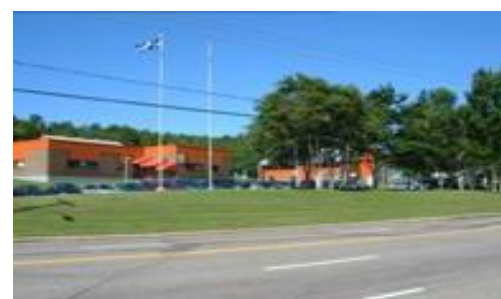
Au coeur du campus...