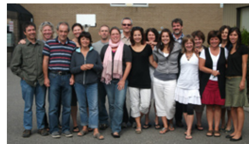
Une équipe-école tissée très serrée pour accueillir ces jeunes aux besoins particuliers.