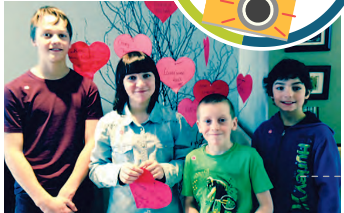
Activités de la Saint-Valentin