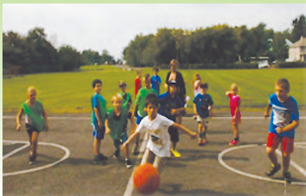
Activités sportives extérieures