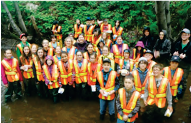
Projet PAJE : revitalisation des bassins versants