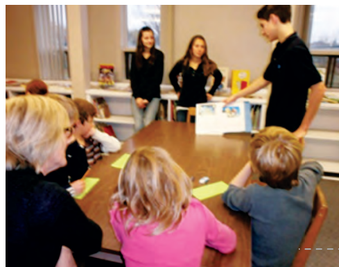
Visite des élèves du secondaire