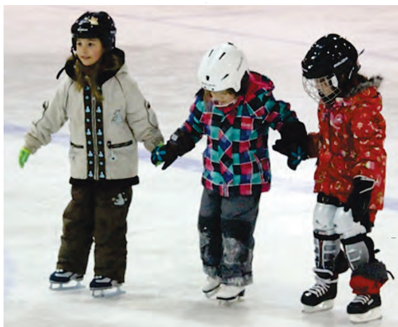
Séances de patinage libre