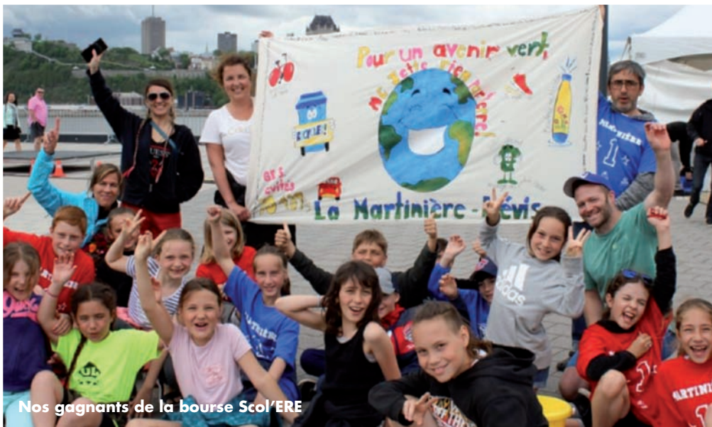
Nos gagnants de la bourse Scol'ERE