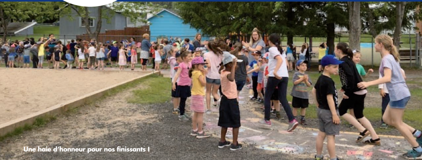
Une haie d'honneur pour nos finissants !