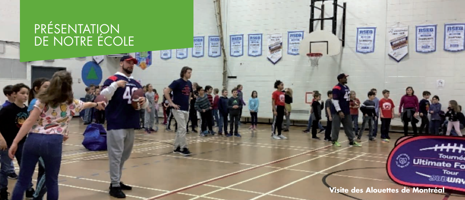
Visite des Alouettes de Montréal