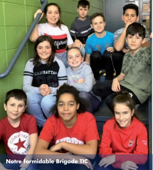
Notre formidable Brigade TIC