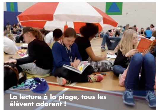
La lecture à la plage, tous les élèves adorent !