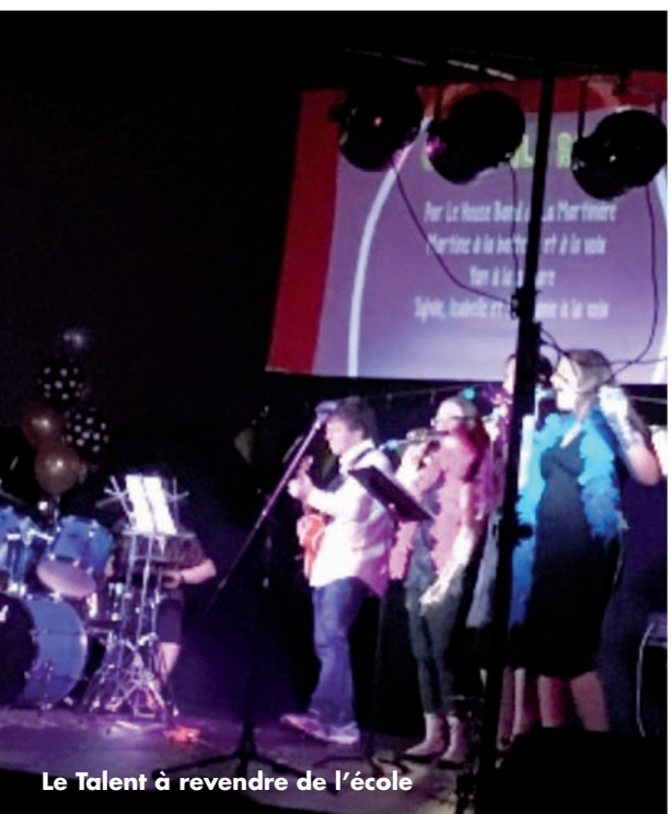
Le Talent à revendre de l'école