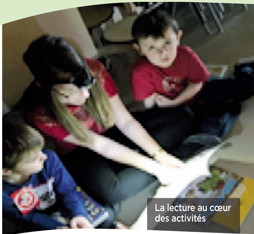
La lecture au cœur des activités