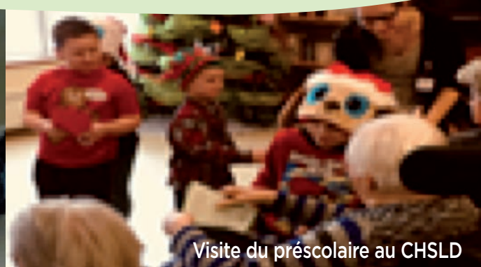
Visite du préscolaire au CHSLD