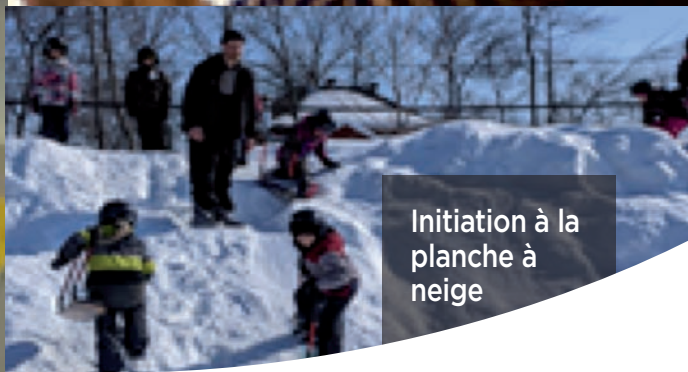
Initiation à la planche à neige