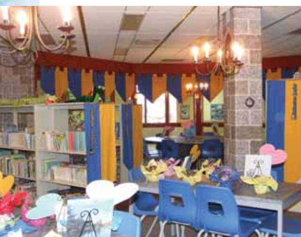
La Forteresse du savoir : La bibliothèque réaménagée devient un lieu magique avec ses allures de château.