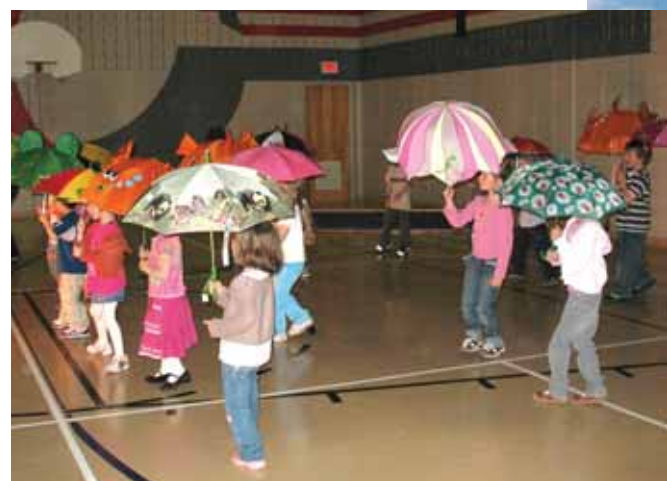
Au service de garde « Les copains d'abord », les élèves s'amuse vraiment. Lors d'un spectacle, la danse des parapluies a eu beaucoup de succès.