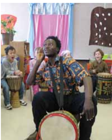
Un merveilleux moment : Un atelier de djembe au préscolaire.