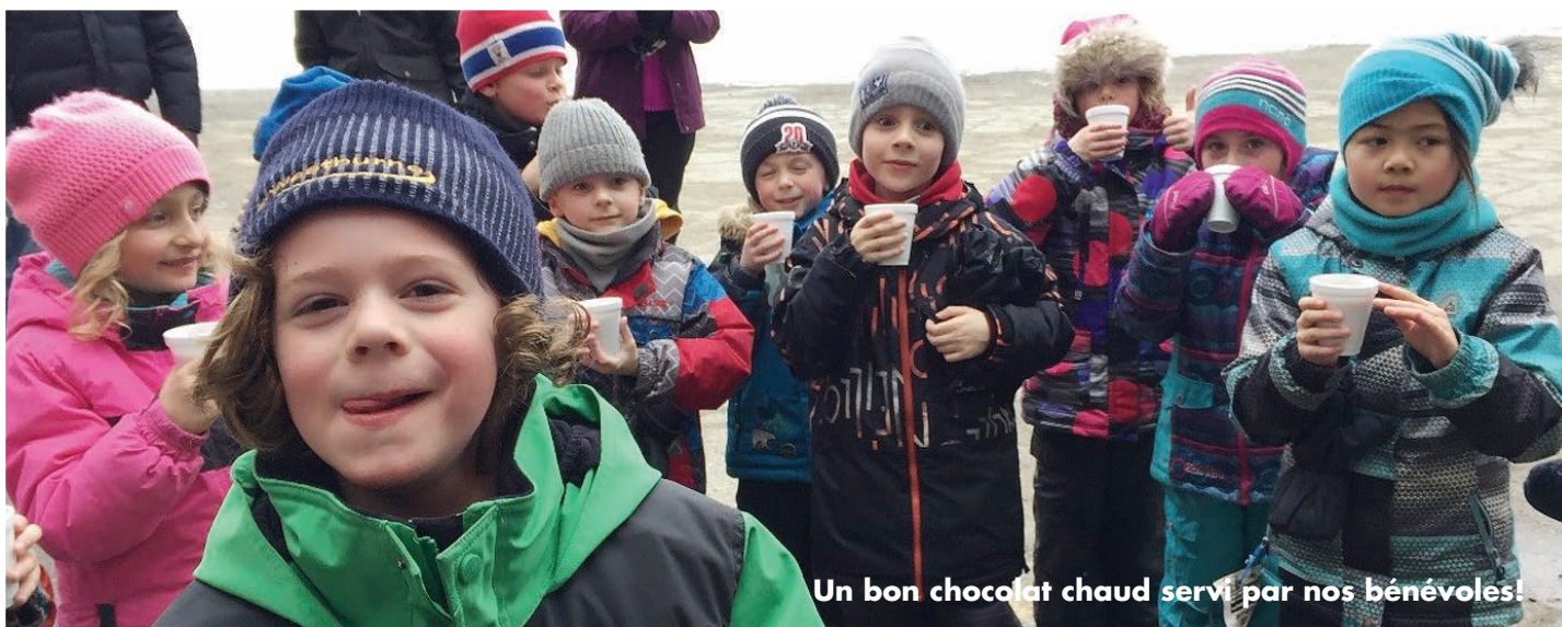
Un bon chocolat chaud servi par nos bénévoles!