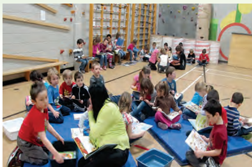
Le goût et le plaisir de lire aux Petits-Cheminots