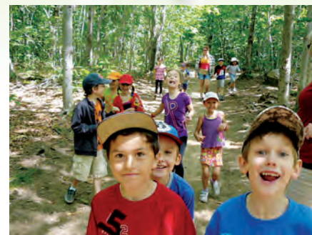
Le Camp Bourg-Royal