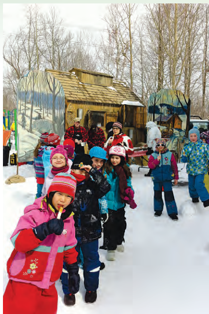
La cabane à sucre