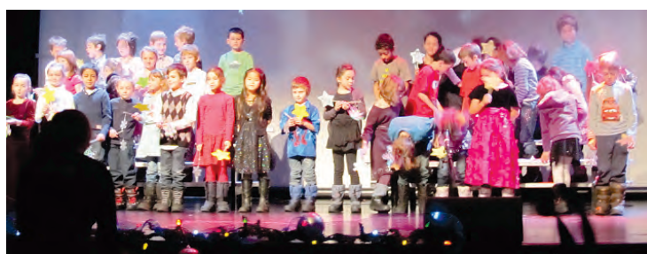
Le spectacle de Noël