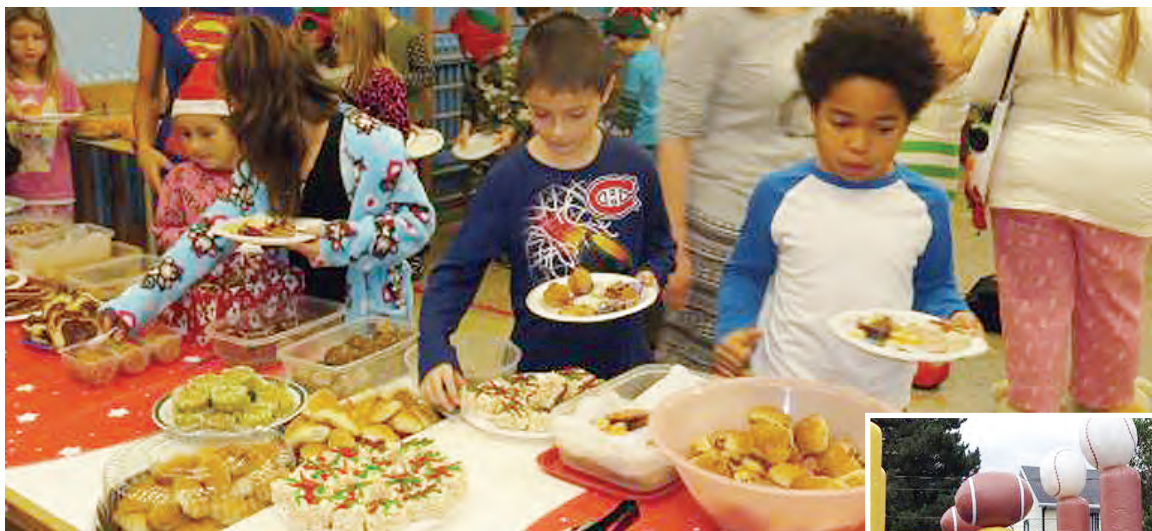
Brunch de Noël