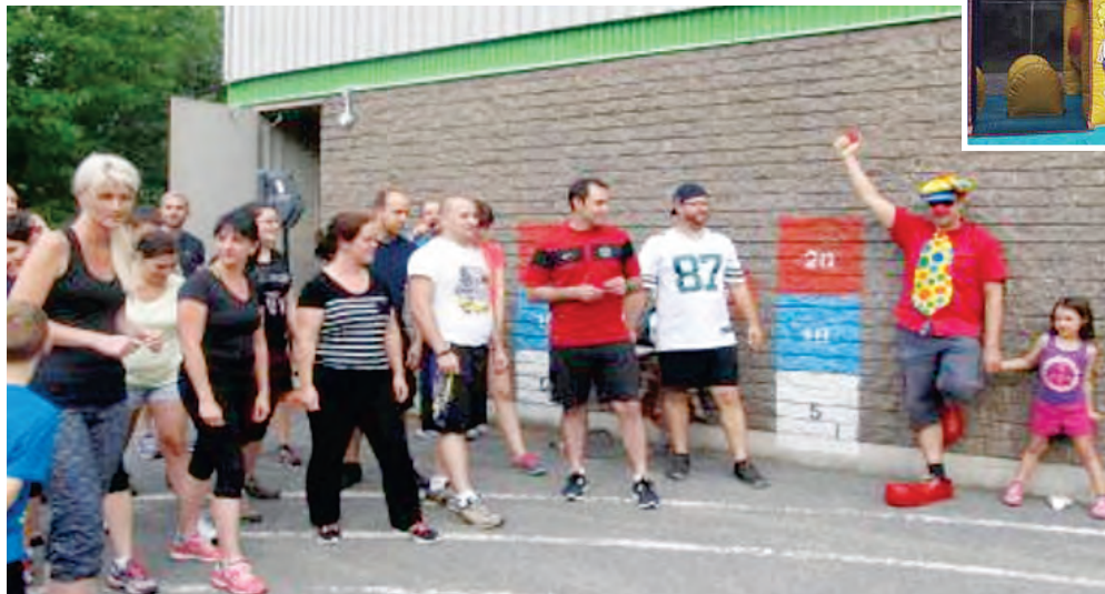
Course familiale 3 x 3