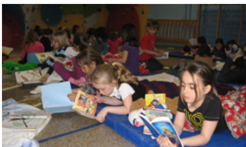
La semaine du français, toute une réussite !

L'École des Petits-Cheminots a proposé, pour l'année scolaire 2010-2011, une variété d'activités et de projets permettant d'avoir toujours comme priorité, dépistage et prévention. Le quotidien de l'équipe-école est teinté des quatre orientations de la planification stratégique de la commission scolaire et fidèle au projet éducatif de l'école. Dû au jeune âge de la clientèle, des services en soutien à l'élève viennent combler les nombreuses demandes. L'équipe est fière d'y répondre positivement et ce, dans le but de donner le meilleur départ dans le parcours scolaire de chaque enfant.