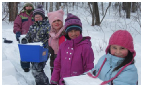
La Fête de la neige : le froid ne nous fait pas peur !