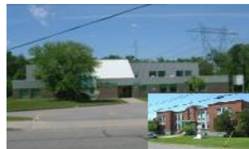
L'École des Petits-Cheminots compte deux pavillons : Notre-Dame et La Passerelle.

Étant donné le jeune âge des élèves qui fréquentent les deux pavillons, la réussite de ceux-ci est axée sur la prévention et la mise en place de stratégies gagnantes pour soutenir et surtout outiller cette jeune clientèle. De plus, le service de garde de l'École des Petits-Cheminots occupe une place importante : plus de 90 % des élèves le fréquentent sur une base régulière ou sporadique. Son programme éducatif complète bien les orientations du projet éducatif de l'école.