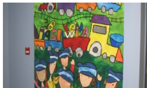
Nouvelle murale : Embarquement immédiat pour l'apprentissage...