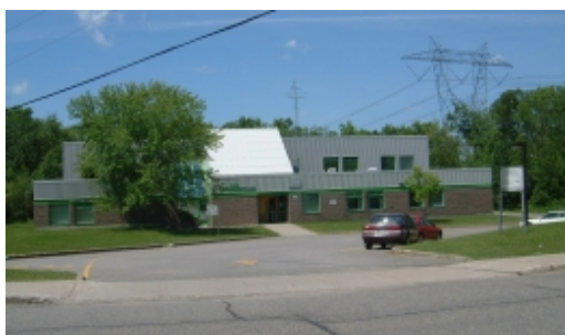
École de la Passerelle

Étant donné le jeune âge des élèves qui fréquentent les deux écoles, la réussite de ceux-ci est axée sur le dépistage , la prévention et la mise en place de stratégies gagnantes pour soutenir et, surtout, outiller cette jeune clientèle. Une classe langage de 1 er cycle dessert aussi toute la Commission scolaire des Navigateurs. De plus, le service de garde de l'École des Petits-Cheminots occupe une place importante : plus de 90 % des élèves le fréquentent sur une base régulière ou sporadique. Son programme éducatif complète bien les orientations du projet éducatif de l'école.