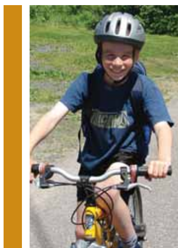
Une sortie à vélo pour les élèves du 2 e et 3 e cycle.