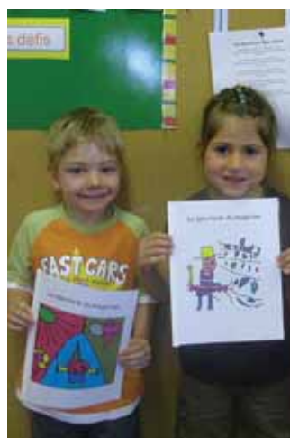
Des auteurs en herbe, nos élèves du préscolaire...