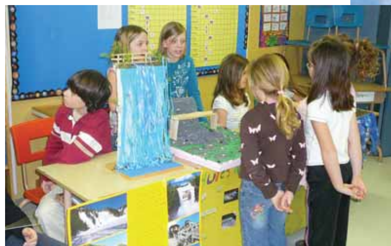
Une exposition « Les merveilles du monde » qui a permis aux élèves de 4 e année de travailler à un projet en collaboration avec des élèves de 6 e année de l'Odysée.