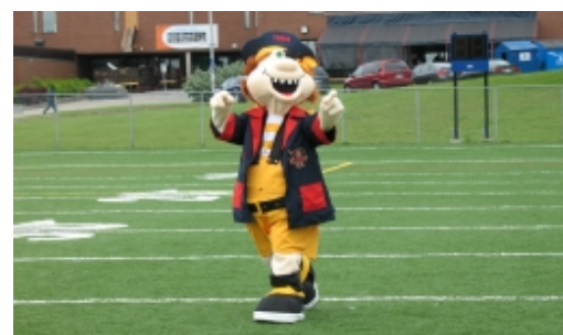
La mascotte des Corsaires, personnage très populaire dans les écoles du réseau Desjardins