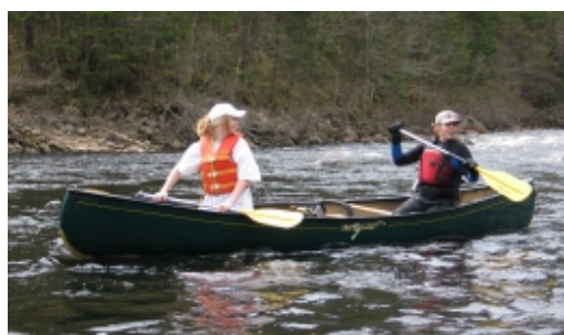
Activité dans le cadre du Club plein air de l'école