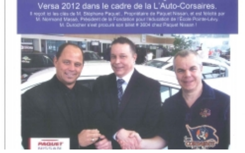
L'auto Corsaires, première activité majeure de financement de la Fondation pour l'Éducation à l'École Pointe-Lévy