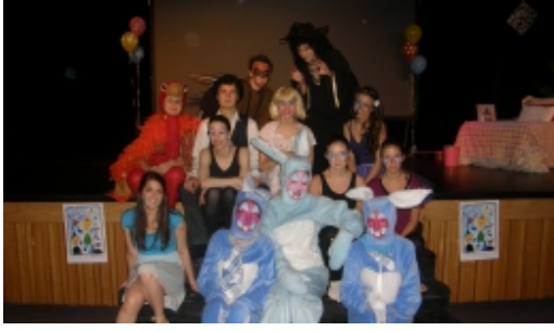
« Émilie Jolie », conte musical à la portée de tous les enfants des écoles du réseau Desjardins