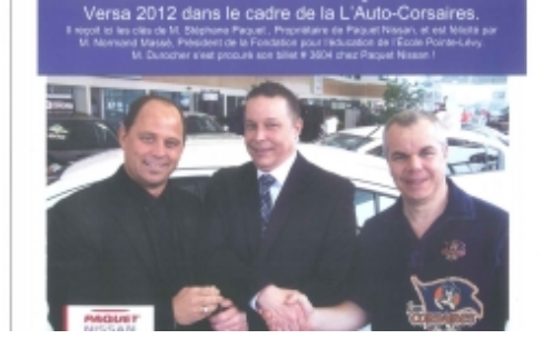
L'auto Corsaires, première activité majeure de financement de la Fondation pour l'Éducation à l'École Pointe-Lévy