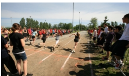
Les olympiades annuelles, grand moment de rassemblement des élèves

L'École Pointe-Lévy est une école primaire-secondaire de 1 650 élèves répartis dans les programmes suivants : régulier, Programmes Arts-Langues-Sports (PALS), Programme d'éducation internationale (PÉI), profil visant à obtenir les prérequis qui permettront l'accès à la formation professionnelle (Pré-DÉP) et formation aux métiers semi-spécialisés (FMSS).