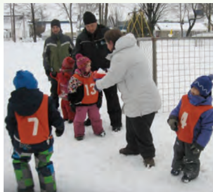
Fête des Neiges avec nos élèves du groupe Passe-Partout