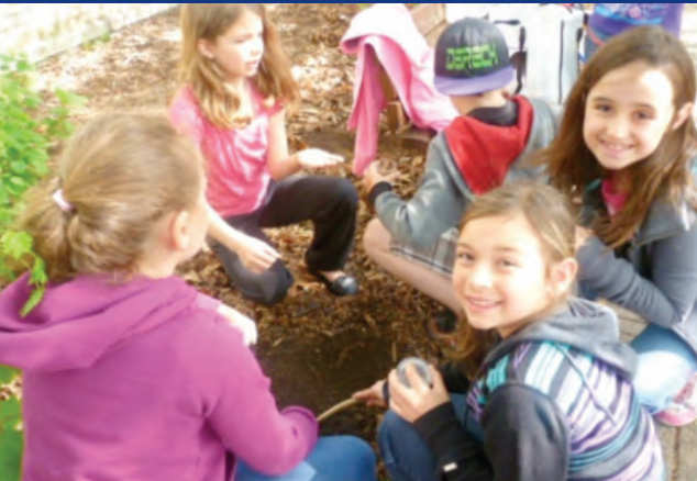
Élèves du 2 e cycle en apprentis entomologistes lors de leur participation au 24 heures de science