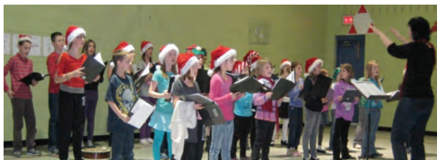
Spectacle de musique présenté lors de la remise d'une subvention du Fonds Amusécole