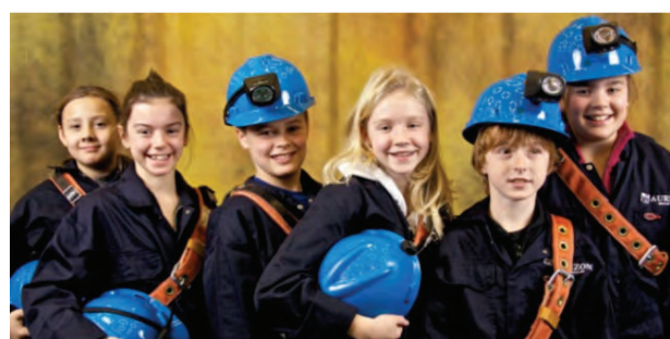
Élèves du 3 e cycle en sortie éducative à Québec Mines