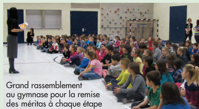
Grand rassemblement au gymnase pour la remise des méritas à chaque étape

Nous avons également révisé notre projet éducatif et ajouté une 4 e orientation, soit de promouvoir de saines habitudes de vie par l'ajout d'activités physiques à l'école et par la sensibilisation aux saines habitudes de vie.