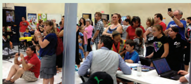
Les élèves sont fiers d'accueillir les parents lors des portes ouvertes et d'exhiber leurs travaux et projets.