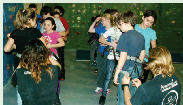
Les brigadiers profitent d'une sortie au « Roc Gym » organisée par le Service de police de Lévis.