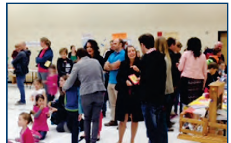
Les élèves sont fiers d'accueillir les parents lors des portes ouvertes et d'exhiber leurs travaux et projets.