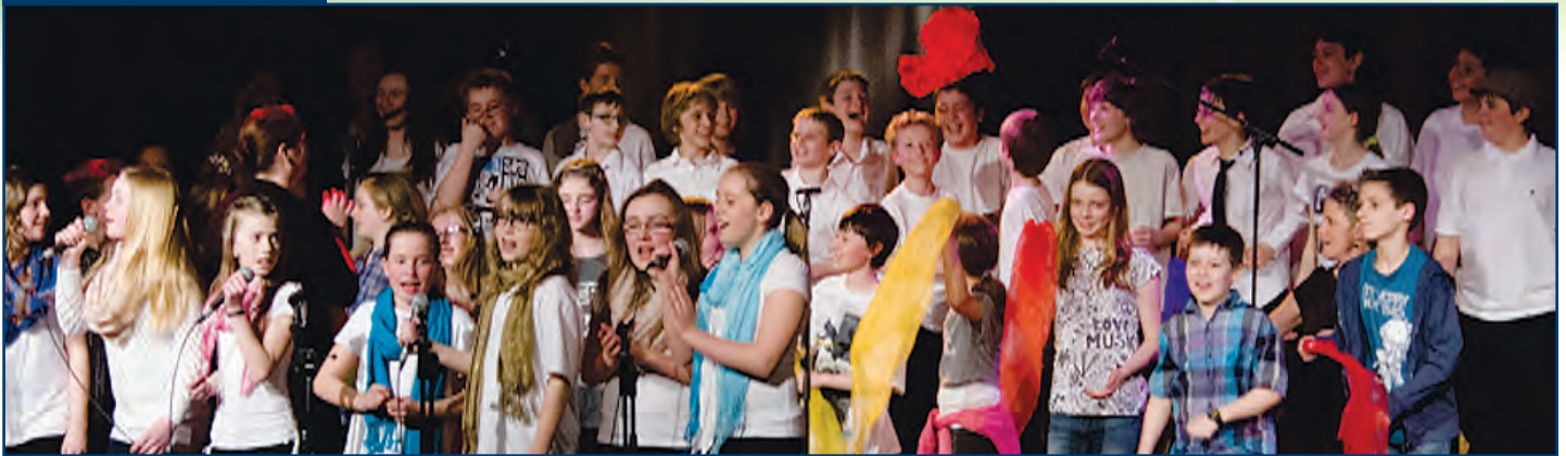
Les élèves du 3 e cycle donnent un bon spectacle lors de la comédie musicale, projet pédagogique particulier de l'école.