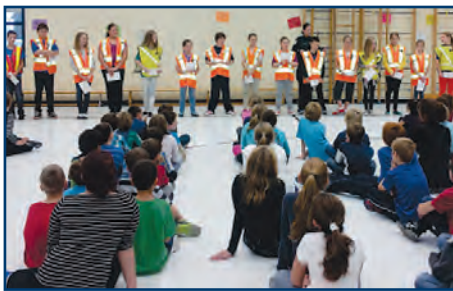
Les brigadiers, lors de l'assermentation par les policiers de la Ville de Lévis