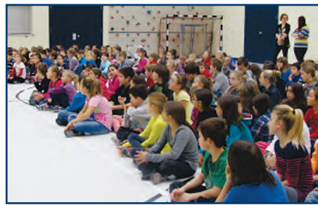
Grand rassemblement au gymnase pour la remise des méritas à chaque étape