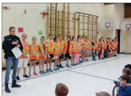
Les brigadiers Lors de l'assermentation par les policiers de la Ville de Lévis