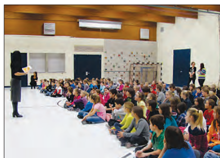
Grand rassemblement Au gymnase pour la remise des méritas chaque étape