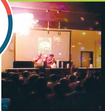
Spectacle de chimie Lors d'une activité récompense d'étape