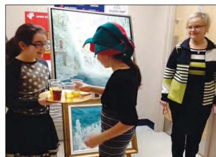
Les élèves sont fiers d'accueillir les parents lors du vernissage au 3 e cycle : portes ouvertes de classes afin d'exhiber leurs travaux et projets concernant le projet « En forme et cultivé » au 3 e cycle