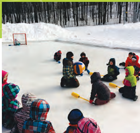
Les élèves lors des olympiades d'hiver

En collaboration avec l'équipe école, nous avons continué la mise en application de notre plan de lutte contre la violence et l'intimidation et ainsi les élèves de l'école ont vécu plusieurs activités de sensibilisation à l'intimidation. Il y a eu mise en place de différents moyens de dénonciation tels que la boîte à dénonciation, les médiateurs dans la cour d'école, des ateliers d'habiletés sociales et plusieurs activités de prévention tout au long de l'année telles des activités sur le civisme.