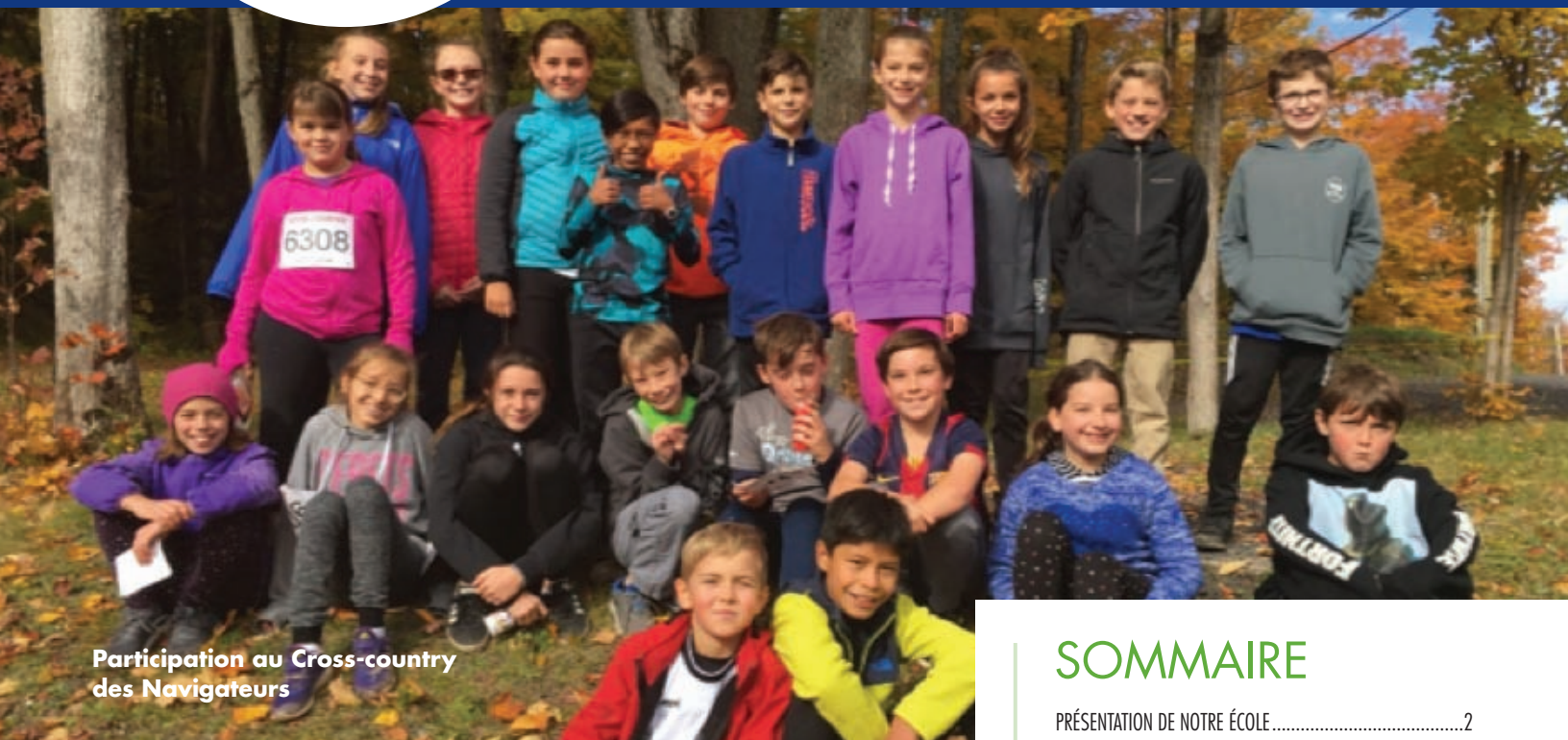
Participation au Cross-country des Navigateurs