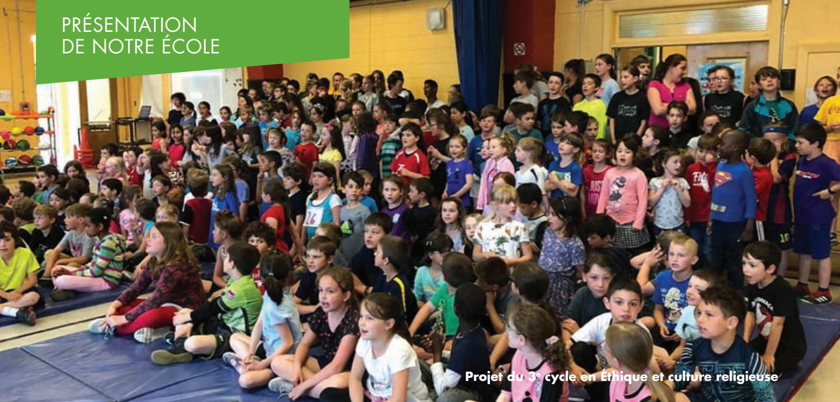
Projet du 3 e cycle en Éthique et culture religieuse