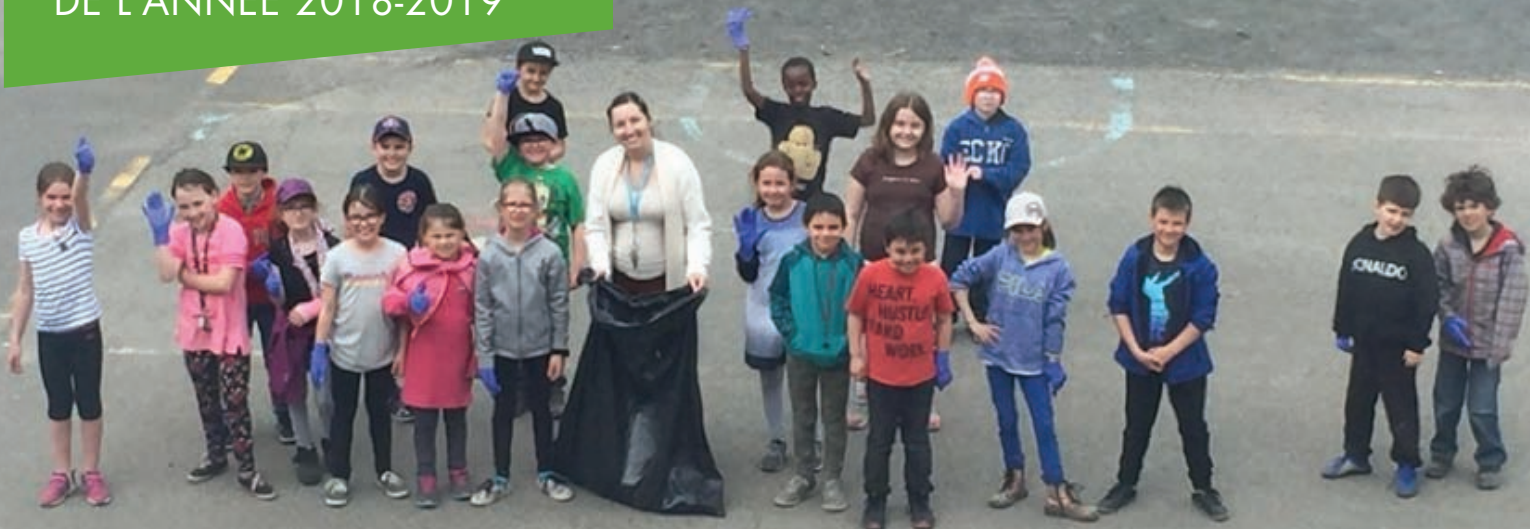
Les élèves de 2 e et 3 e année ont à cœur leur environnement et nettoient la cour de l'école !

D'autre part, les enseignants ont poursuivi le développement de leur formation continue en participant aux projets Voile, Base 10, CAP en écriture et CAP sans papier ni crayon. L'équipe d'enseignants du préscolaire et 1 re année a utilisé la planète des Alphas pour l'apprentissage de la lecture et a également mis en application les connaissances acquises lors de la formation en ergothérapie pour travailler avec les enfants du préscolaire. S'ajoute à cela l'utilisation, par les enseignantes de 1 re année, du coffret d'évaluation en lecture GB+ qui permet de cibler de façon explicite les besoins des élèves afin d'intervenir efficacement auprès de ceux-ci par la suite. De plus, des sous-groupes d'élèves du préscolaire et du 1 er cycle ont pu bénéficier d'ateliers portant sur la conscience phonologique à l'aide de l'orthophoniste et d'une TES langage. Plusieurs bénéficiaires ont été soulignés grâce à cet ajout de service auprès de nos élèves en difficulté.