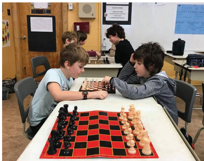
Activité d'échecs pour les élèves de 4 e année

ment été préparée par des élèves fréquentant le service de garde. D'autre part, les élèves ont pu participer à des transitions actives de 20 minutes. L'école se transformant en corridor actif, salle de yoga et de jeux moteurs divers. Aussi, le « Daily Mile » est une activité de course inspirée de la Grande-Bretagne qui s'est déroulée à l'extérieur et a permis aux élèves de profiter des joies du printemps.