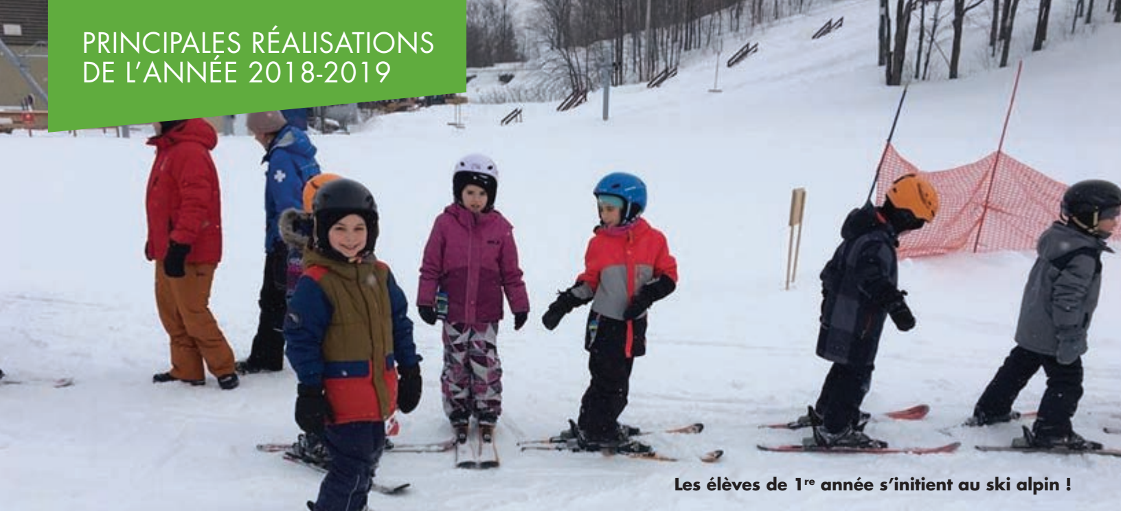
Les élèves de 1 re année s'initient au ski alpin !

En collaboration avec l'équipe-école, nous avons continué la mise en application de notre Plan de lutte contre la violence et l'intimidation. Ainsi, les élèves de l'École Sainte-Marie ont vécu plusieurs activités de sensibilisation à l'intimidation. La mise en place de différents moyens, dont la création de la brigade des Corsaires, les ateliers d'habiletés sociales et plusieurs activités de prévention telles que des activités sur le civisme et l'enseignement explicite des comportements attendus sont de belles preuves de la mise en œuvre de ce plan.