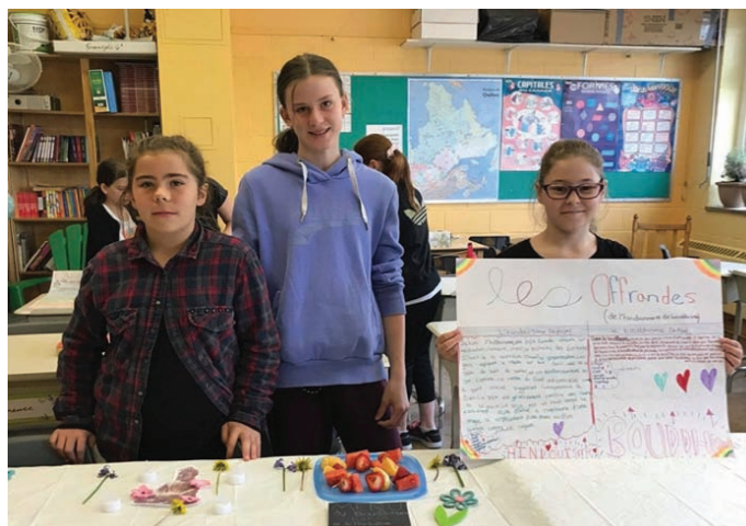
Projet du 3 e cycle en Éthique et culture religieuse

La participation de l'École Sainte-Marie dans sa communauté a pris tout son sens par la réalisation de diverses activités ainsi que par la tenue d'une soirée d'information pour les parents sur la plateforme Web Alloprof.