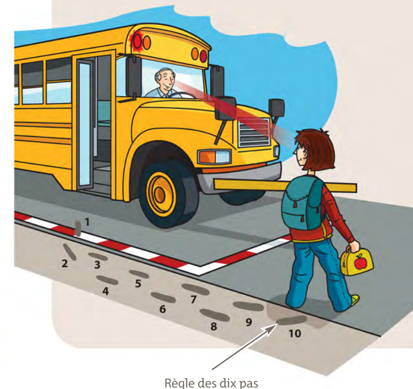
Règle des dix pas